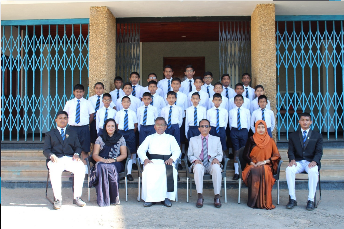
Middle School Students & The Staff