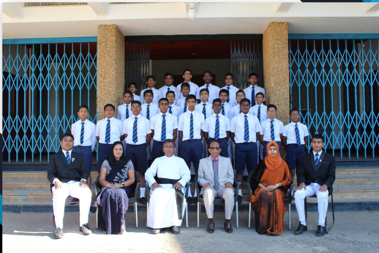
Upper School Students & The Staff