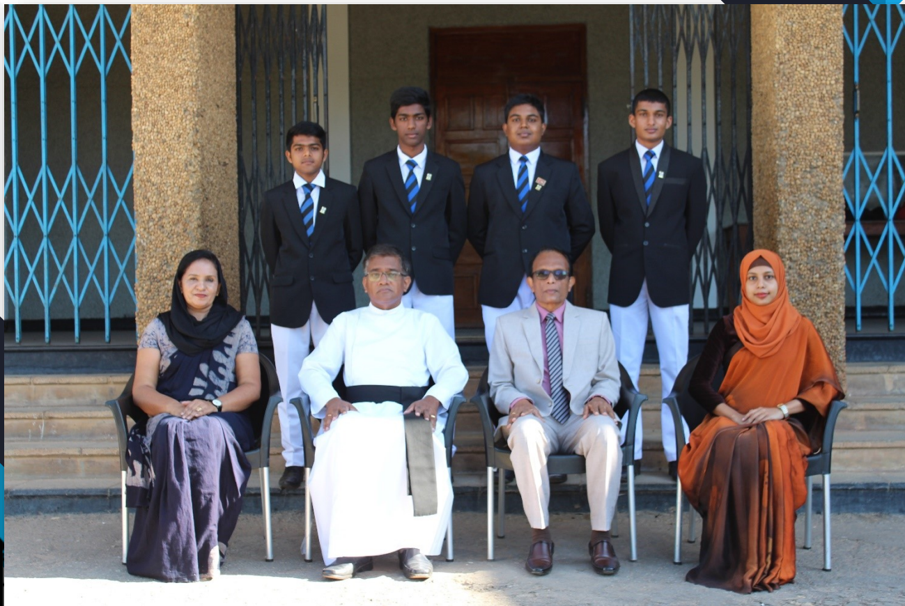
Organizing Committee & The Staff