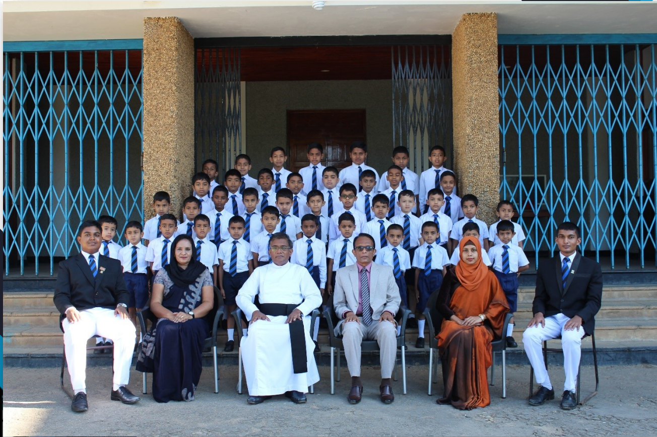
Primary School Students & The Staff